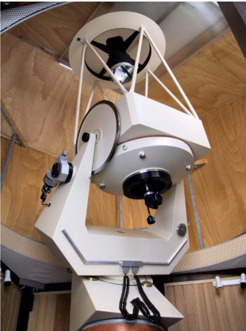
Selbst gebautes Hauptinstrument der Sternwarte Harpoint