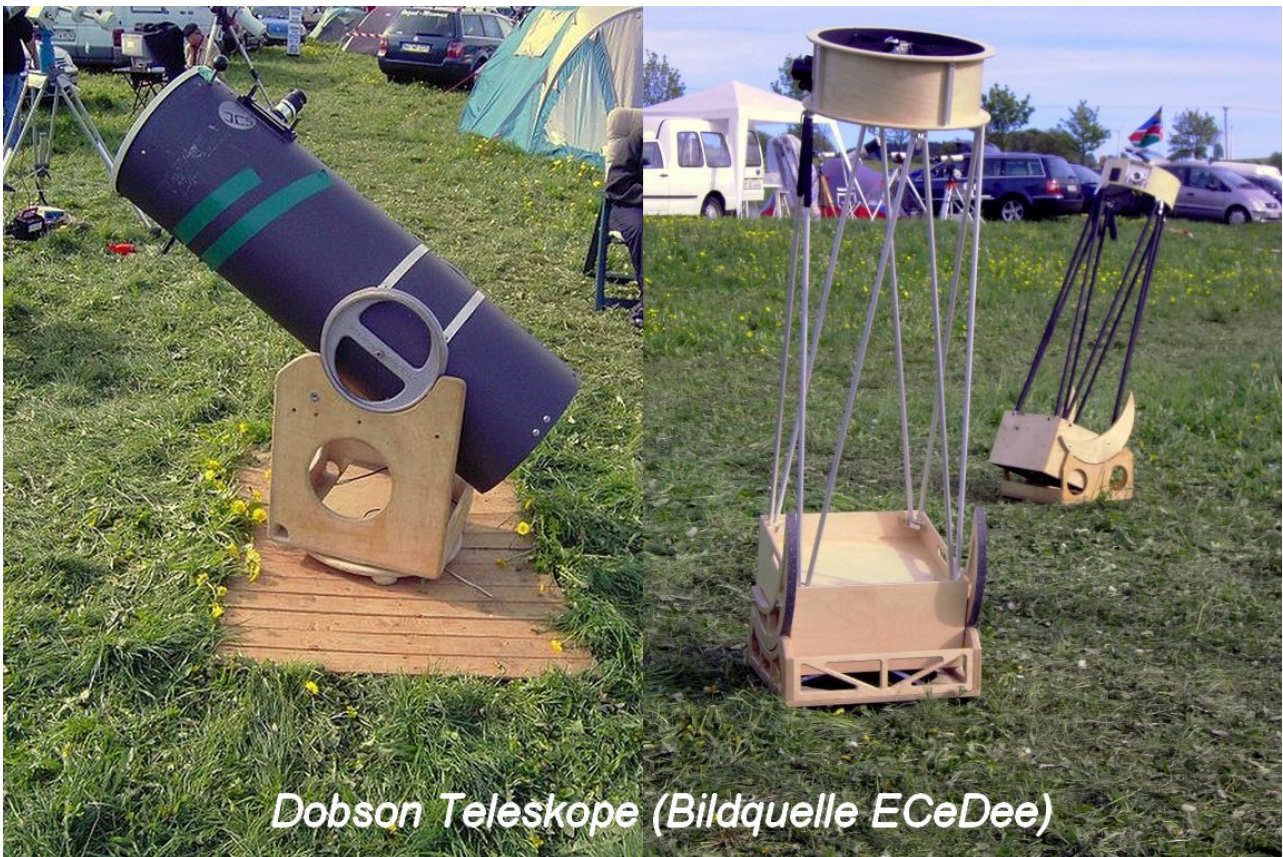
Dobson Teleskope

Eine echte Alternative zu diesen hochtechnisierten Computerteleskopen ist ein Teleskop ganz ohne Motoren und Elektronik. Es ist zum Transport gut zerlegbar, mechanisch einfach aufgebaut, wird nur von Hand bewegt und nachgeführt und eignet sich deswegen nur zur visuellen Beobachtung des Himmels mit dem Auge, nicht zur Astrofotografie. Hier muss sich der Benutzer normalerweise selbst am Himmel zurechtfinden können (abgesehen von wenigen Typen mit Elektronik und GoTo). Was man sich an der aufwendigen Mechanik und Elektrik anderer Bauarten erspart, kann man in eine größere Optik investieren. Diese einfache Bauart für ein Fernrohr wurde von dem Amerikaner John Dobson entwickelt. Mit einem Dobson-Teleskop (ohne Elektronik) ist der Einsteiger gezwungen, sich selbst am Sternenhimmel zu orientieren. Er wird schnell lernen, wie man die hellsten Himmelsobjekte mit dem Teleskop auffinden kann. Die Jagd nach schwach leuchtenden Objekten durch Orientierung an hellen Sternen in ihrer Umgebung kann sich zu einer spannenden Herausforderung entwickeln. Man bedient sich der Hilfe von gedruckten Sternkarten oder Planetariumsprogrammen am PC. Das erwähnte „Google Sky“ ist sowohl am Mobiltelefon als auch am Internet-PC heutzutage eine brauchbare Alternative. Wer sein neues Hobby auf diese Weise startet, dem bleiben Enttäuschungen durch unzureichende Billigteleskope erspart.