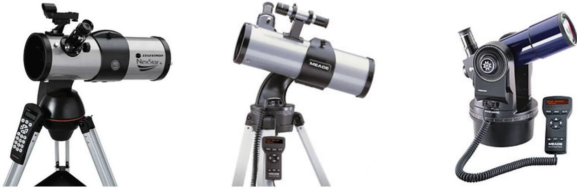
Beispiele für Spielzeugteleskope mit GoTo-Funktion: kleine Öffnung und wackelige Montierung (Bildquelle und Hersteller: Celestron, Meade)

Der elektrische Antrieb eines Teleskops dient ja nicht nur zur automatischen Einstellung von Himmelsobjekten durch den eingebauten Computer. Der Antrieb soll in erster Linie die Erddrehung ausgleichen, das motorisierte Teleskop also auf die Sterne „nachführen“. Bei den elektrisch angetriebenen Hobbyteleskopen unterscheidet man hinsichtlich der Montierung üblicherweise zwischen 2 verschiedenen Bauformen.