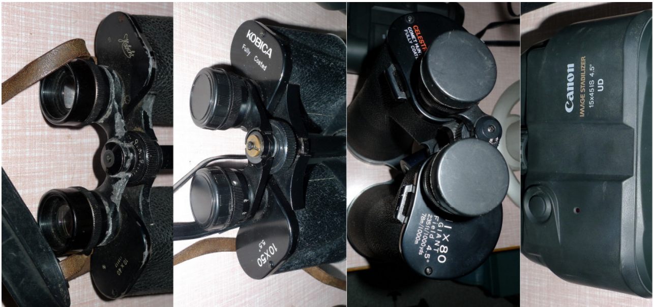
Eine Auswahl von Feldstechern, die wir selbst verwenden.